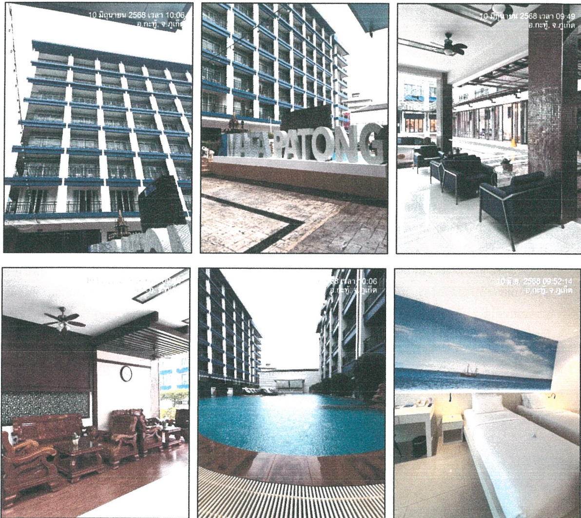
รูปภาพที่ 1.3 การใช้พื้นที่ของโครงการ